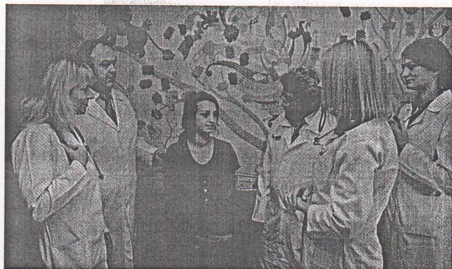
Фото 5. Співробітники кафедри педіатрії та медичної генетики на обході у ендокринологічному відділенні обласної дитячої клінічної лікарні.