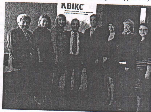
Фото 2. Міжнародна науково-практична конференція «Сучасні методи діагностики в педіатрії» (Чернівці, 2013)

13 нововведеннях, 11 інформаційних листів України та впроваджені шляхом захисту та використання в навчальному процесі та щоденній праці лікарів профільних відділень тісно співпрацює та поглиблює наукову співпрацю з науковцями інших закладів України, США, Румунії, Російської Федерації (фото 2).