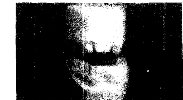
Рис. 3. Моделі верхньої і нижньої щелеп хворого С. (контакт зубів у фронтальній і бічних ділянках відсутній)

товлена індивідуальна ложка із Протакрилу-М, якою після корекції знято функціональний відбиток за допомогою сіласту. По одержаному відбитку відлита модель верхньої щелепи на якій з метою вибору конструкції проведена паралелометрія методом вибору. Вирішуючи третє питання нами вперше запропонована конструкція суцільнолитого протезу з розбірним дубльованим зубним рядом , на який подана заявка на винахід. Запропонована конструкція складається із 3-х частин: