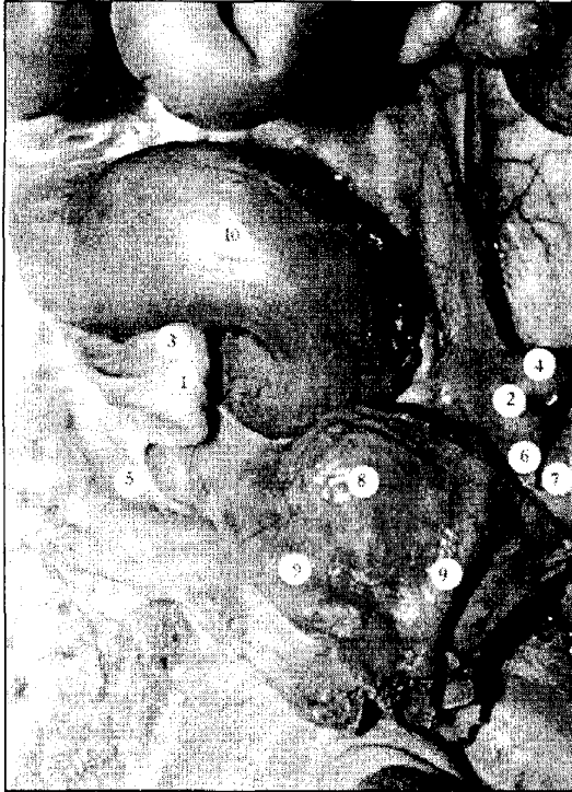
Рис. 1. Органи черевної порожнини плода 230,0 мм ТКД. Макропрепарат. Зб. х2

1 - праве яєчко; 2 - ліве яєчко; 3 - праве над'яєчко; 4 - ліве над'яєчко; 5 - повідець правого яєчка; 6 - повідець лівого яєчка; 7 - піхвовий відросток очеревини; 8 - сечовий міхур; 9 - пупкової артерії; 10 - сигмоподібна ободова кишка.