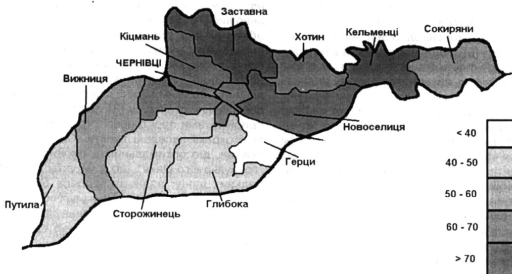
Рис. 1. Поширеність захворювань нервової системи серед дітей Чернівецької області за районами (картосхема).

них захворювань. Ми проаналізували їх у межах одного району – Глибоцького (рис. 2). Просторовий розподіл нерівномірний, значно виділяються окремі населені пункти, в яких кількість випадків у декілька разів більша, ніж у сусідніх з ними поселеннях. Розташовані ці пункти переважно у низинній частині вздовж річки Сирет та її приток. Формалізовані показники підтверджують таку асоціацію – коефіцієнт кореляції Спірмена між частотою випадків та їх ландшафтным розташуванням вказує на їх позитивний зв'язок ( r=0,53 , p<0,05 ).