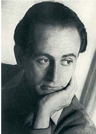
Рис. 4. Paul Celan , який не став нобелівським лауреатом штама, Поля Валері, Артюра Рембо... Людина, яка отримала вищу літературну винагороду Німеччини – премію Георга Бюхнера, поет Голокосту і періоду денацифікації Німеччини, а його «Фуга смерті» увійшла у всі антології німецької поезії ХХ сторіччя. І одночасно, знову фіксуємо зв'язок з медициною – навчання у Франції в Туринському університеті з медицини, замість якої, після аншлюсу, повернення до Чернівців і студіювання

Сену. У кишені загиблого знайшли документ, що повідомляв, що це був Пауль-Лео Antshel (Анчель) , громадянин Австрії 1920 року народження, за національністю – єврей, професія – літератор, у Парижі жив постійно з 1950 року. Під час окупації 20-річний юнак втратив всіх близьких, жив у Румунії, Австрії, Франції, літератор трагічної поезії, блискучий перекладач, завдяки якому Німеччина познайомилася з творчістю Олександра Блока, Сергія Єсеніна, Осипа Мандель-