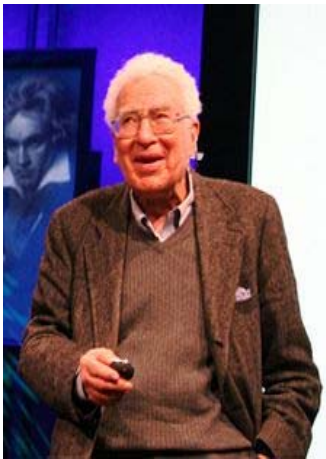
Рис. 2. Murray Gell-Mann , нобелівський лауреат з фізики 1969 року

Більш щільний родинний зв'язок з Чернівцями в наступного вченого – Murray Gell-Mann (рис. 2),