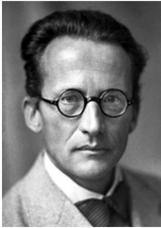
Рис. 1. Erwin Schrödinger , нобелівський лауреат з фізики 1933 року

у Відні 4 січня 1961 року у віці 73 років від туберкульозу.