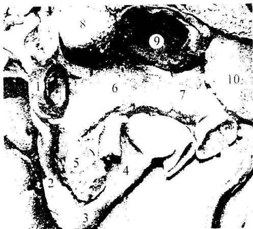
Рис. 1. Органи живота плода 250,0 мм ТПД. Макропрепарат. 36. x 1,4.

1 – верхня частина ДПК; 2 – низхідна частина ДПК; 3 – нижня частина ДПК; 4 – висхідна частина ДПК; 5 – голівка ПЗ; 6 – тіло ПЗ; 7 – хвіст ПЗ; 8 – хвостата частка печінки; 9 – шлунок; 10 – селезінка.