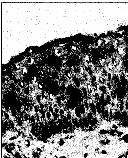
Рис. 2. Эпидермис воспаленной кожи при АД. CD80+ клетки с морфологическими свойствами ДК Лангерганса. X 400

сом. Следствием дефицита CD4+CD25+FoxP3+ Т лимфоцитов будет активация эффекторных Т лимфоцитов путем взаимодействия CD28 молекулы Т клетки с лигандой CD86 дендритической клетки при ее миграции из эпидермиса в дерму. Итогом взаимодействия будет продолжающаяся активность воспалительного процесса без должного корректирующего действия отсутствующих CD4+CD25+FoxP3+ Т лимфоцитов.