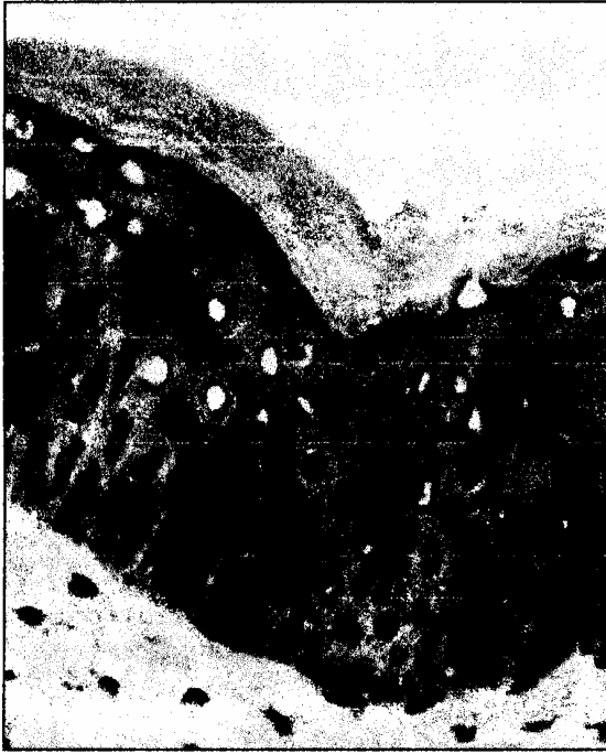
Рис. 3. Епідерміс запаленої шкіри при АД. CD86+ клітини з морфологічними властивостями ДК Лангерганса. X 400

Functional CD86 (B7-2/B70) is predominantly expressed on Langerhans cells in atopic dermatitis. // Br. J. Dermatol. - 1997 - V.136 - P.838-845. 11. Stry G., Bangert C., Stingl G., Kopp T. Dendritic cells in atopic dermatitis: expression of Fc \gamma RI on two distinct inflammation-associated subsets. // Int. Arch. Allergy Immunol. - 2005 - V.138 - P.278-290. 12. Sansom D.M., Manzotty C.N., Zheng Y. What's the difference between CD80 and CD86 // TRENDS in Immunology. - 2003 - V.24 - P.313-318. 13. Verhagen J., Akdis M., Traidl-Hoffmann C., et al. Absence of T-regulatory cell expression and function in atopic dermatitis. // J. Allergy Clin. Immunol. - 2006 - V.117 - P.176-183.