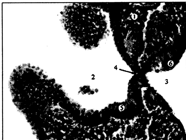
Рис. 2. Сагиттальный срез зародыша человека 3,2 мм ТКД (24 сутки). Окраска гематоксилином и эозином. Ок. 15 х , об. 20 х : 1 – краниальный участок зародыша; 2 – первичная ротовая полость; 3 – полость краниального отдела передней кишки; 4 – ротовая пластинка (глоточная мембрана); 5 – эпителий первичной ротовой полости; 6 – эпителий передней кишки.

Судя по ядерно-цитоплазматическому соотношению и тинкториальным свойствам, можно сделать вывод, что пролиферативные процессы в околоэпителиальной зоне мезенхимы протекают более интенсивно, чем в отдалённых от эпителия участках.