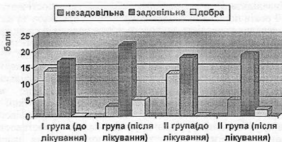
Рис.1 Динаміка суб'єктивної оцінки пацієнтами свого стану в процесі лікування

комплексів подібного складу при найбільш поширених оксидантзалежних захворювань.