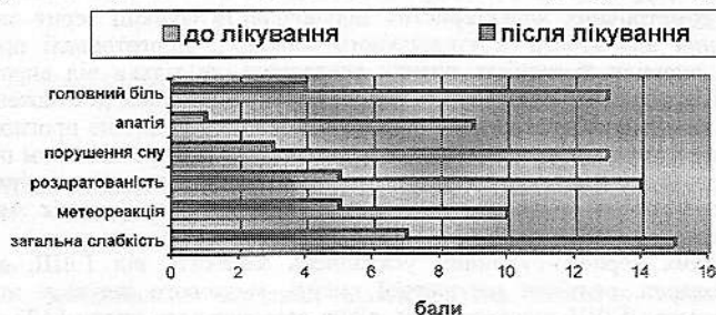
Рис.2 Динаміка скарг пацієнтів