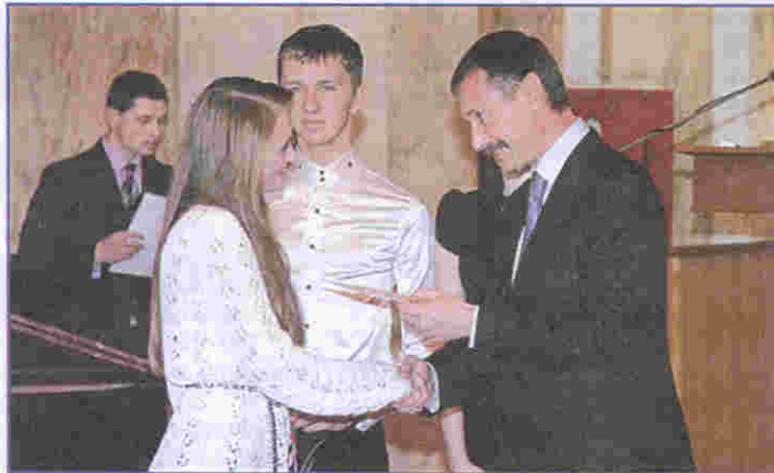
Губернатор краю вітає студентку нашого вишу