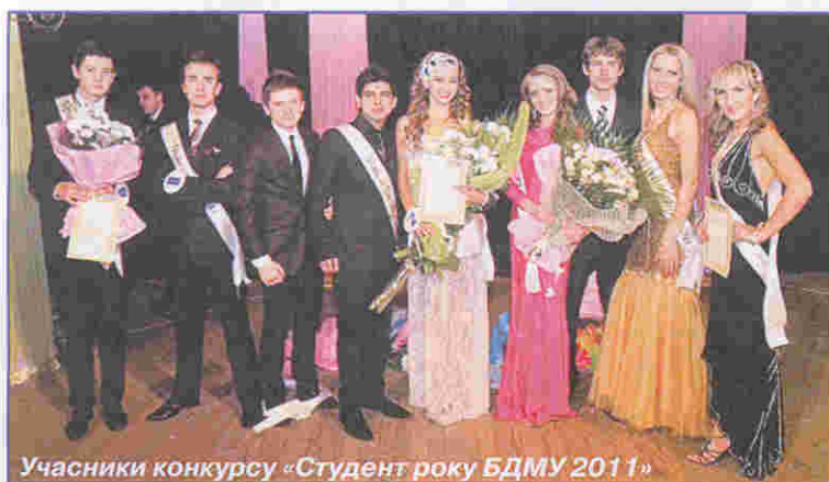
Учасники конкурсу «Студент року БДМУ 2011»