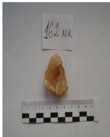
Рис. 3. Внутрішня поверхня клаптя шкіри.

Проведена низка контактограм з використанням методу отримання кольорових відбитків (за Кустановичем С. Д. (1965)) з послідовним застосуванням лужних і кислотних реактивів-розчинників, відповідним проявленням за допомогою рубіано-водневої кислоти та сірчистого натрію. На отриманих контактограмах будь-якого забарвлення, що б вказувало на присутність слідів міді, нікелю, кобальту, свинцю, не виявлено. Встановлений крововилив м'яких тканин 5-го міжреберного проміжку овальної форми розмірами 1,2×0,9 см. Будь-яких ушкоджень і порушень анатомічної цілості наданих фрагментів 4-го, 5-го, 6-го ребер з правої половини грудної клітки не виявлено.