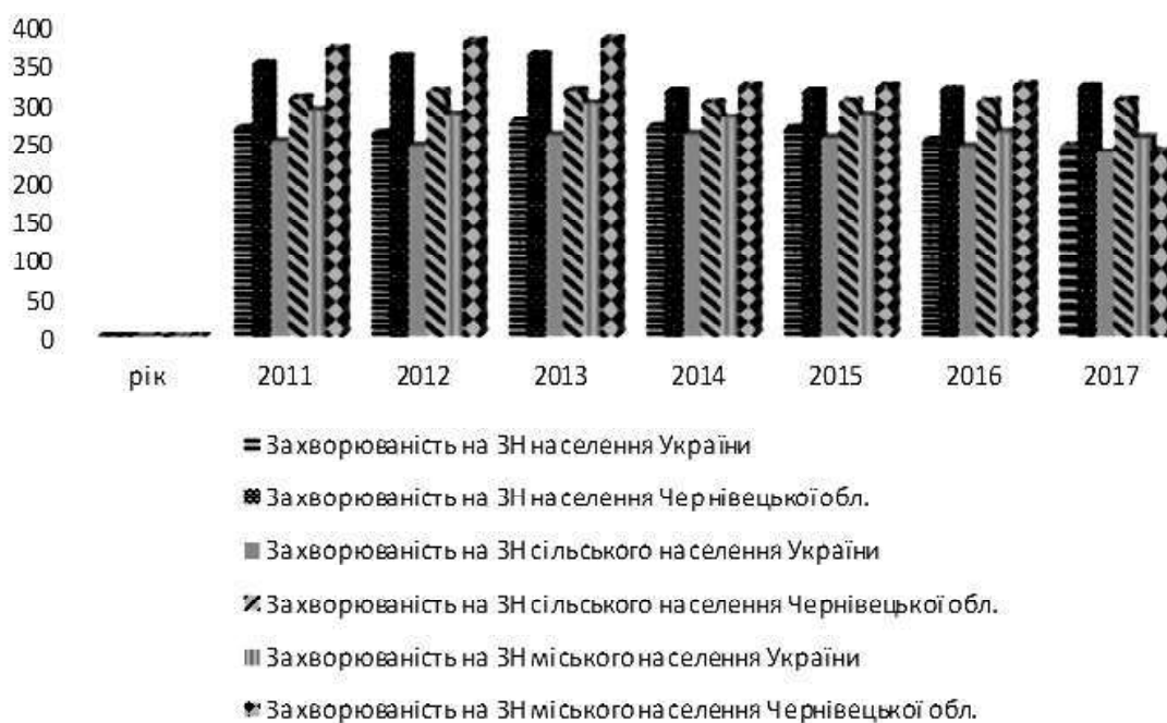
Рисунок 1. Захворюваність на злоякісні новоутворення серед міського та сільського населення Чернівецької області та України