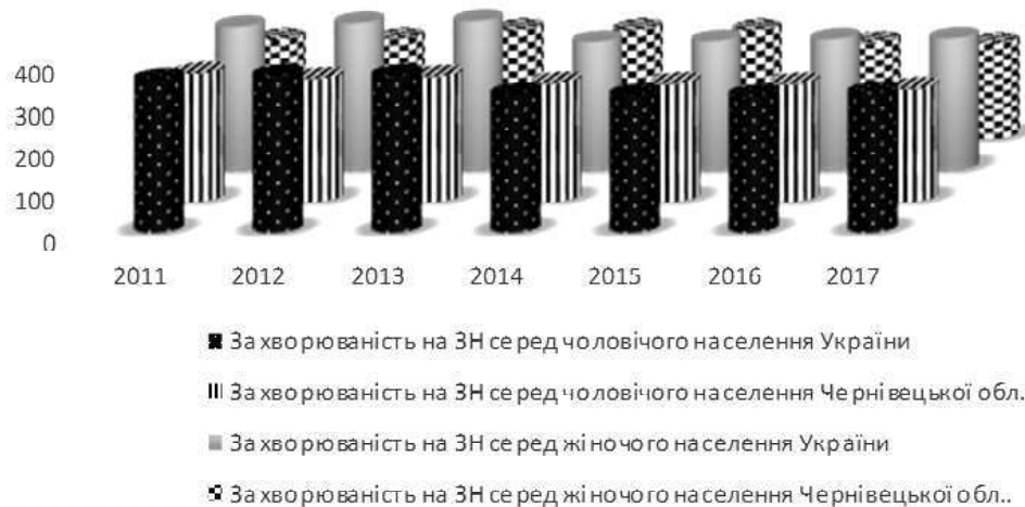
Рисунок 2. Захворюваність на злоякісні новоутворення серед чоловічого та жіночого населення Чернівецької області та України