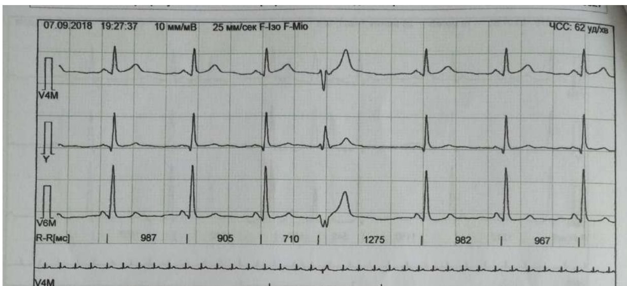
Рис.1. Поодинокі шлуночкові екстрасистоли

Холтер ЕКГ: у хворой за період моніторингування зафіксовано 55 передчасних шлуночкових комплексів, що представлені: політопними, шлуночковими екстрасистолами, епізодами шлуночкової бігеменії, епізодами шлуночкової тригеменії, поодинокими передчасними