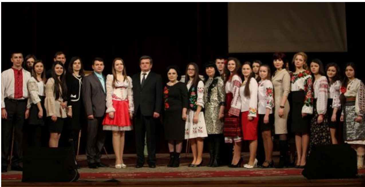
«Ми чуємо тебе, Кобзарю, крізь століття»