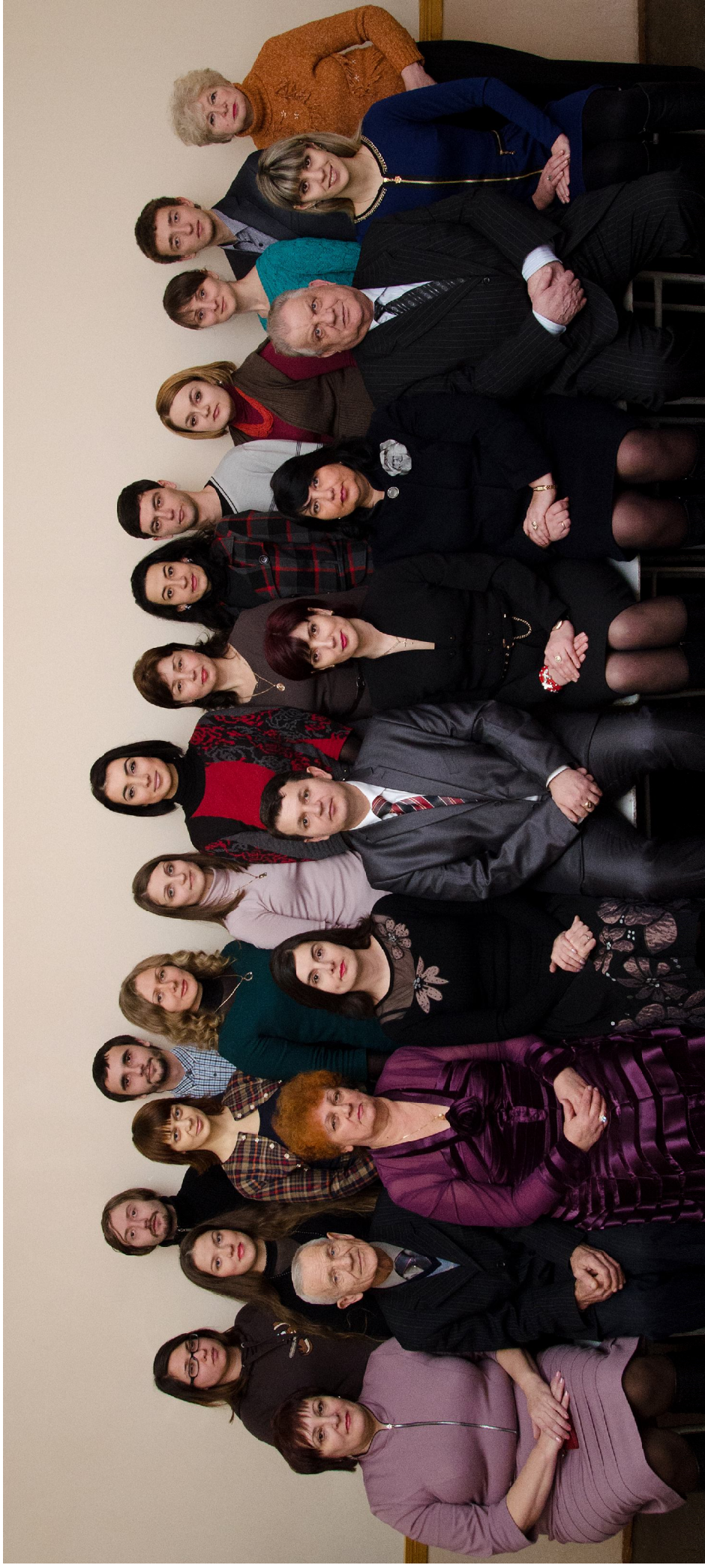
Колектив кафедри суспільних наук та українознавства 2013 - 2014 рр.