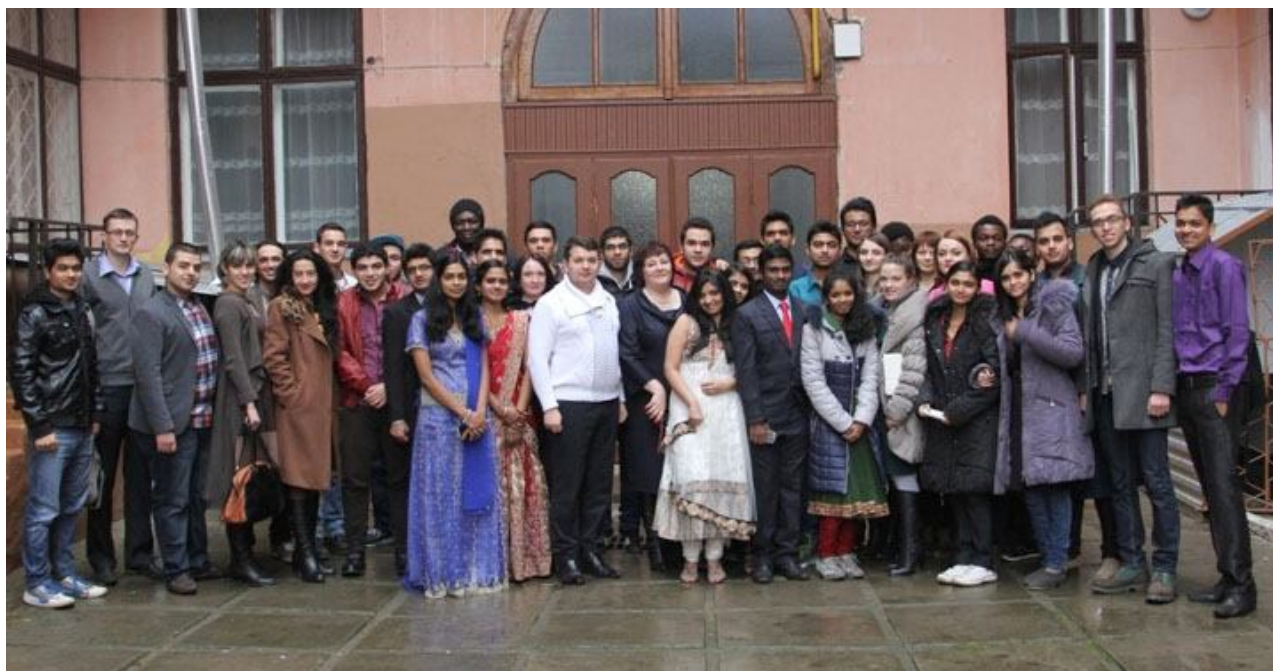
Під час заходу «Рідне Шевченкове слово»