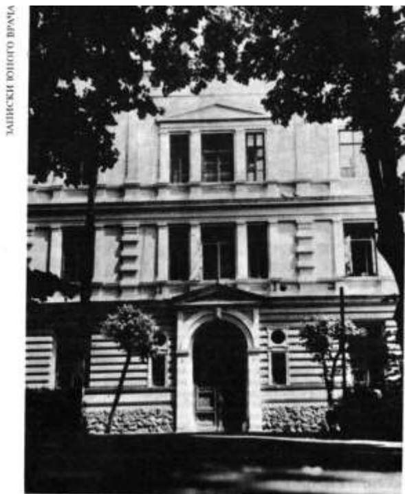
Чернівцівський військовий госпіталь. Юго-Західного фронту. Фото Д. Мислова, 1989.