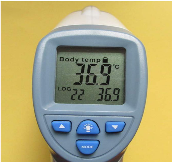
Рис. 1. Екран пірометра з даними останнього вимірювання та середньою величиною трьох останніх показників

зних засобів для лікування ЦД. Хоча спеціальної дієти дотримувалася більша частина обстежених пацієнтів, втім 37,5 % не застосовували ніяких обмежень у харчуванні, а в чотирьох осіб мало місце зловживання алкоголем. Серед ускладнень ЦД були порушення зору різного ступеня (11 осіб – 68,8 %), ураження нирок та нижніх кінцівок (по чотири особи – 25 %). Надлишкова маса тіла вважається одним із чинників розвитку захворювань серцево-судинної системи, артеріальної гіпертензії, особливо в поєднанні із ЦД, а також фактором ризику виникнення періопераційних ускладнень. Тільки п'ять пацієнтів (31,2 %) мали нормальні показники ІМТ, дев'ять осіб (56,2 %) – мали надлишкову масу тіла і у двох було ожиріння, а середній показник ІМТ по групі склав 26,5 \pm 0,9 \text{ кг/м}^2 . Більшість пацієнтів (68,5 %) мала підвищений артеріальний тиск: середня величина систолічного тиску склала 140,3 \pm 4,6 \text{ мм Нг} , діастолічного – 87,8 \pm 3,5 \text{ мм Нг} . Рівень цукру крові при госпіталізації був у межах від 4 до 21 ммоль/л, середній показник у обстежених склав 9,17 \pm 1,02 \text{ ммоль/л} . Явища анемії були в чотирьох пацієнтів. Окремо в пацієнтів