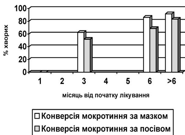
Рис.2. Динаміка припинення бактеріовиділення за результатами мазок/посів у хворих другої групи

Тобто, ймовірність збільшення тривалості інтенсивної фази хіміотерапії залежить від наявності первинної медикаментозної резистентності МБТ до АМБП, яка також суттєво впливала на кінцеві на результати основного курсу хіміотерапії. Між показниками “невдача лікування” та “ефективне лікування” й медикаментозною резистентністю також встановлений вірогідний зв'язок ( \chi -квадрат = 13,04 при критичному значенні 3,84).