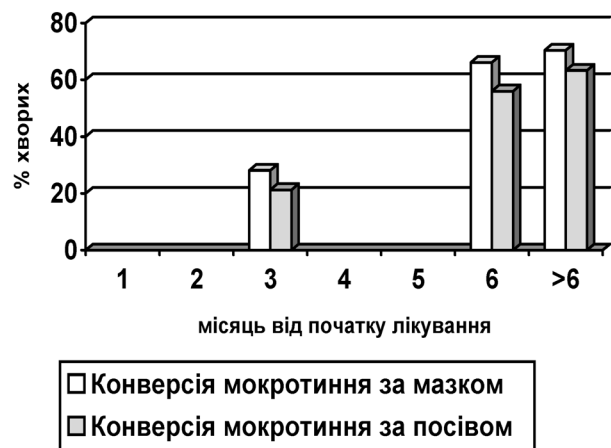
Рис. 1. Динаміка припинення бактеріовиділення за результатами мазок/посів у хворих першої групи

У першій групі хворих, що лікувалися за стандартним режимом ДОТС програми впродовж перших 3 місяців хіміотерапії (рис. 1) припинення бактеріовиділення відбулося за мазком у 9 випадках (28,1±7,8%), за посівом – у 7 (21,3±9,9%). Припинення бактеріовиділення реєструвалося простим методом у 22 хворих (66,1±7,8%), методом посіву – у 18 пацієнтів (56,0±4,8%). Тобто “невдача лікування” за терміном основного мар-