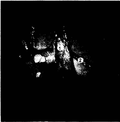
Рис. 2. Ветви подвздошно-ободочной артерии плода 270 мм ТПД. Сосуды заполнены полихромной смесью на основе универсального клея. Макропрепарат. Ув. х8: 1 – артериальная аркада, образованная подвздошной ветвью подвздошно-ободочной артерии; 2 – артериальное кольцо.