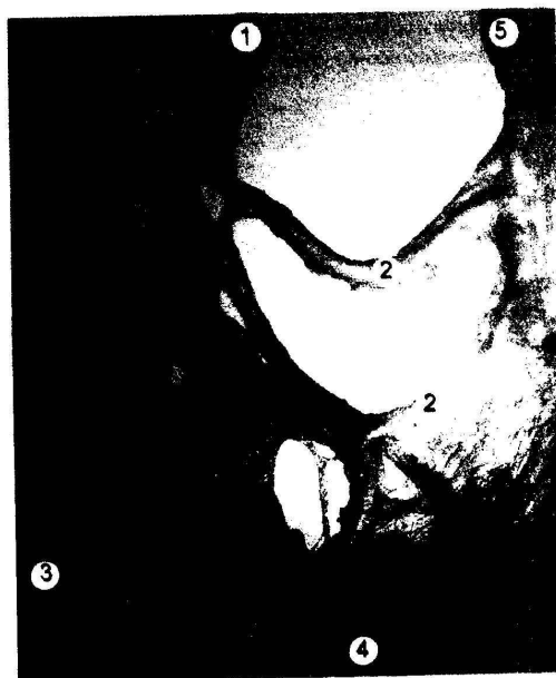
Рис. 1. Ветви подвздошно-ободочной артерии плода 240 мм ТПД. Сосуды заполнены полихромной смесью на основе универсального клея. Макропрепарат. Ув. x16: 1 – подвздошно-ободочная артерия; 2 – артерии червеобразного отростка, образованные подвздошными ветвями подвздошно-ободочной артерии; 3 – восходящая ободочная кишка; 4 – подвздошная кишка; 5 – подвздошная артерия.

В 24-х случаях ободочная ветвь была отдельной ветвью ПОА. Из них в 5-ти случаях она отдавала пристеночную (краевую) ветвь, которая анастомозировала в 3-х случаях со слепокишечными ветвями, в 2-х – с артериальным кольцом, образованным подвздошной ветвью, артериями червеобразного отростка и слепокишечными артериями. В 6-ти случаях ободочная ветвь ПОА отходила от артериального кольца, образованного подвздошной ветвью и слепокишечной артериями ПОА (5), в 1-м случае от артериального кольца, образованного артериями червеобразного отростка, подвздошной ветвью и слепокишечной артериями, отходило две ободоч-