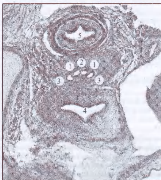
Рис. 1. Горизонтальний зріз передплота 37,0 мм тім'яно-куприкової довжини. Забарвлення гематоксиліном і еозином. Мікропрепарат. Об. 8, ок. 7: