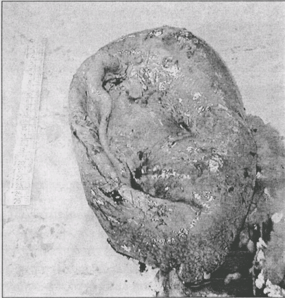
Рис. 1. Гігантська кіста селезінки.