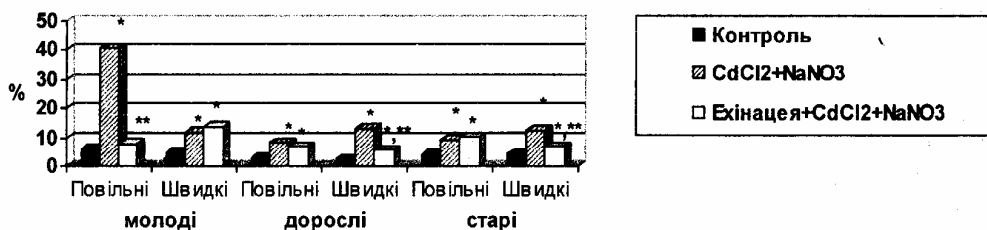
Рис.2. Вплив настоянки ехінацеї пурпурової на рівень метгемоглобіну в крові щурів різного віку за умов підгострого впливу нітрату натрію та хлориду кадмію

Отже, найбільше зростання даного показника відмічалось у молодих тварин із "повільним" типом ацетилювання та в меншій мірі в дорослих і старих осіб зі "швидкою" ацетилюючою здатністю. Отримані результати доповнюють дані літератури щодо більш вираженого токсичного впливу нітрату натрію [2] на молодих тварин порівняно з дорослими, оскільки в наших дослідженнях більш схильними до розвитку метгемоглобінемії були тільки "повільні" ацетилятори інфантильного віку. На практиці це означає, що групою ризику до виникнення водно-нітратної метгемоглобінемії можуть бути діти з "повільним" типом ацетилювання.