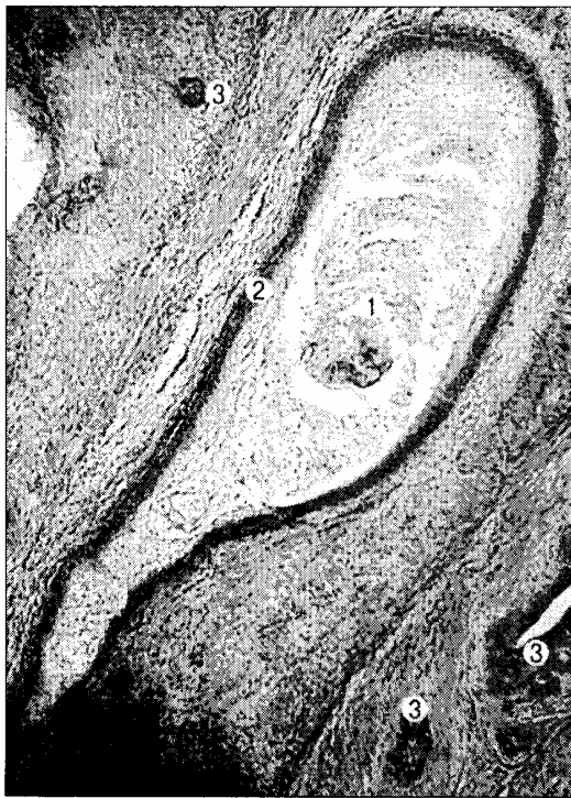
Рис. 2. Сагітальний зріз передміхурової залози плода 270,0 мм ТКД. Забарвлення гематоксиліном і еозином. Мікропрепарат. Об. 3,5, ок. 10: 1 – вміст порожнини передміхурового мішечка; 2 – стінка передміхурового мішечка; 3 – залозисті утворення передміхурової залози.

них борозен, коливається від 5 до 11. З боку бічних стінок передміхурової частини сечівника відкривається найменша кількість залозистих утворень (3-14) у порівнянні з іншими стінками. На цій стадії спостерігається зменшення розмірів залозистих утворень передньої стінки сечівника, а також редукція деяких з них. Кількість залозистих утворень передньої стінки сечівника становить 11-14. Спостерігається процес перетворення залозистих ходів у трубчасті, що є вивідними протоками ПМЗ. Залозисті ходи ПМЗ вистелені багатошаровим кубічним епітелієм.