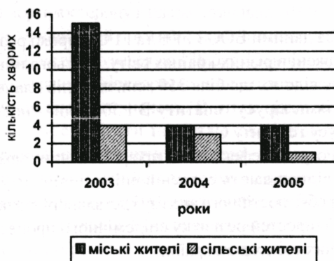
Гострий гепатит С

Враховуючи парентеральний механізм передачі даних захворювань, проаналізували шляхи та чинники його реалізації. Встановлено, що в 65% хворих на ГГВ інфікування відбулося внаслідок медичних маніпуляцій, у тому числі 16% - переливання крові, 64% - екстракція зубів, 16% - гінекологічні маніпуляції та один випадок інфікування медичного працівника, пов'язаний із професійною діяльністю. Систематично вводили внутрішньовенно наркотичні речовини 19% осіб. Крім того, серед опитаних хворих у 7% пацієнтів були статеві або побутові контакти з особами, інфікованими вірусом гепатиту В. У 2,6% осіб - косметологічні маніпуляції. При ГГС найбільшого епідеміологічного значення в поширенні захворювання має ін'єкційне введення наркотичних речовин (62% пацієнтів). Актуальним також залишається інфікування внаслідок медичних маніпуляцій (18%) та статевим шляхом (9%). У ряді випадків не вдалося з'ясувати шлях інфікування вірусами гепатитів (11%).