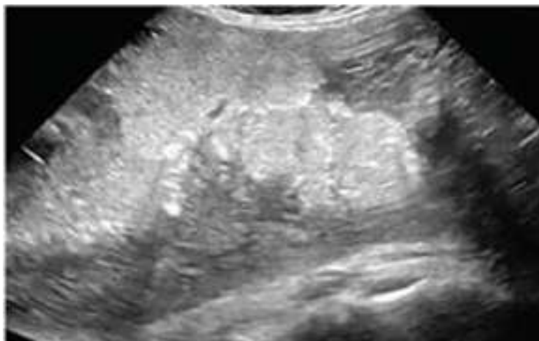
Рис. 3. Петрифікати, кальцинати ІБ підгрупа (основна група)

Наявність змінених структур у плаценті (петрифікати, кальцинати, кісти) майже в 2,3 разів частіше зустрічались у жінок ІБ підгрупи (рис. 3), у порівнянні з жінками ІА підгрупи (рис. 4) та у 9,6 разів в порівнянні зі здоровими вагітними (рис. 5).