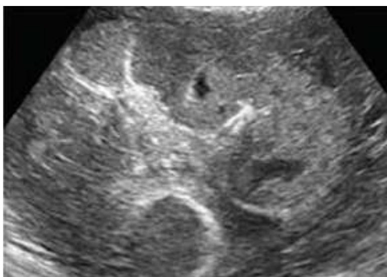
Рис. 4. Петрифікати, кальцинати ІА підгрупа (основна група)