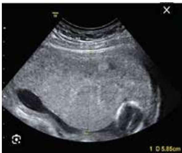
Рис. 2. Потовщення плаценти

Наявність змінених структур у плаценті (петрифікати, кальцинати, кісти) майже в 2,3 разів частіше зустрічались у жінок ІБ підгрупи (рис. 3), у порівнянні з жінками ІА підгрупи (рис. 4) та у 9,6 разів в порівнянні зі здоровими вагітними (рис. 5).