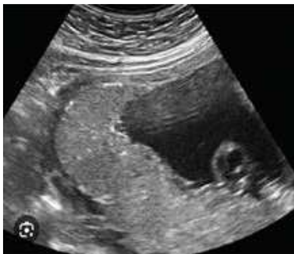
Рис. 1. Нормальна плацента

Товщина плаценти у жінок ІА підгрупи основної групи складала 35,98 \pm 0,5 мм, а у вагітних (ІБ) підгрупи – 38,61 \pm 0,5 мм, а у здорових вагітних товщина плаценти становила 33,94 \pm 0,4 мм (рис. 1, 2).