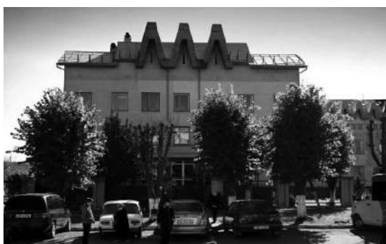
Фото 2. КНП «Міська поліклініка №3»

Кафедра сімейної медицини з самого початку була створена на базі комунального некомерційного підприємства (КНП) м. Чернівці «Міська поліклініка № 3», де в червні 2001 року відкрито відділення сімейної медицини (фото 2). Цей заклад і на сьогодні залишається основною базою кафедри. Додатково клінічними базами кафедри (фото 3-5) є також КНП «Міська поліклініка № 1», ОКНП «Чернівецький обласний перинатальний центр». Для навчального процесу використовуються низка стаціонарних клінічних закладів міста – обласні КНП «Чернівецька обласна клінічна лікарня», «Лікарня швидкої медичної допомоги», «Обласний клінічний кардіологічний диспансер», міська дитяча клінічна лікарня, обласна психіатрична лікарня. Окрім того, консультативно-лікувальна робота викладачами кафедри здійснюється також у позабазових установах міста та області.