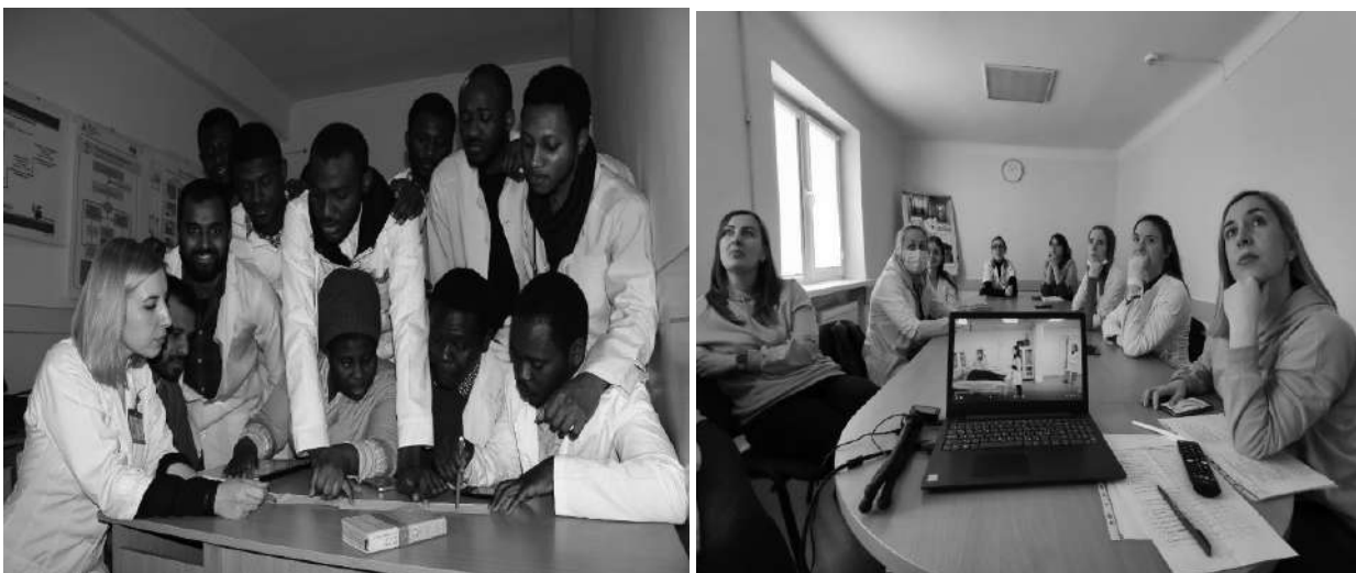
Фото 11. Відпрацювання навичок розшифровки ЕКГ з іноземними студентами, а також розгляд клінічного випадку разом із лікарями-інтернами