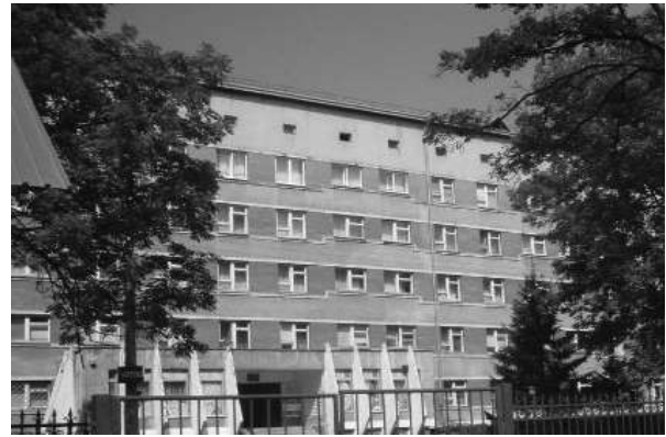
Фото 5. ОКНП «Чернівецький обласний перинатальний центр»

Сучасні методи навчання дають можливість здобувачам освіти отримувати знання дистанційно та безперервно. Одним із таких є сервер дистанційного навчання БДМУ електронних навчальних курсів