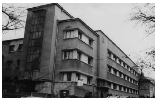
Фото 3. КНП «Міська поліклініка №1

Клінічна та експериментальна патологія. 2024. Т.23, № 2 (88)