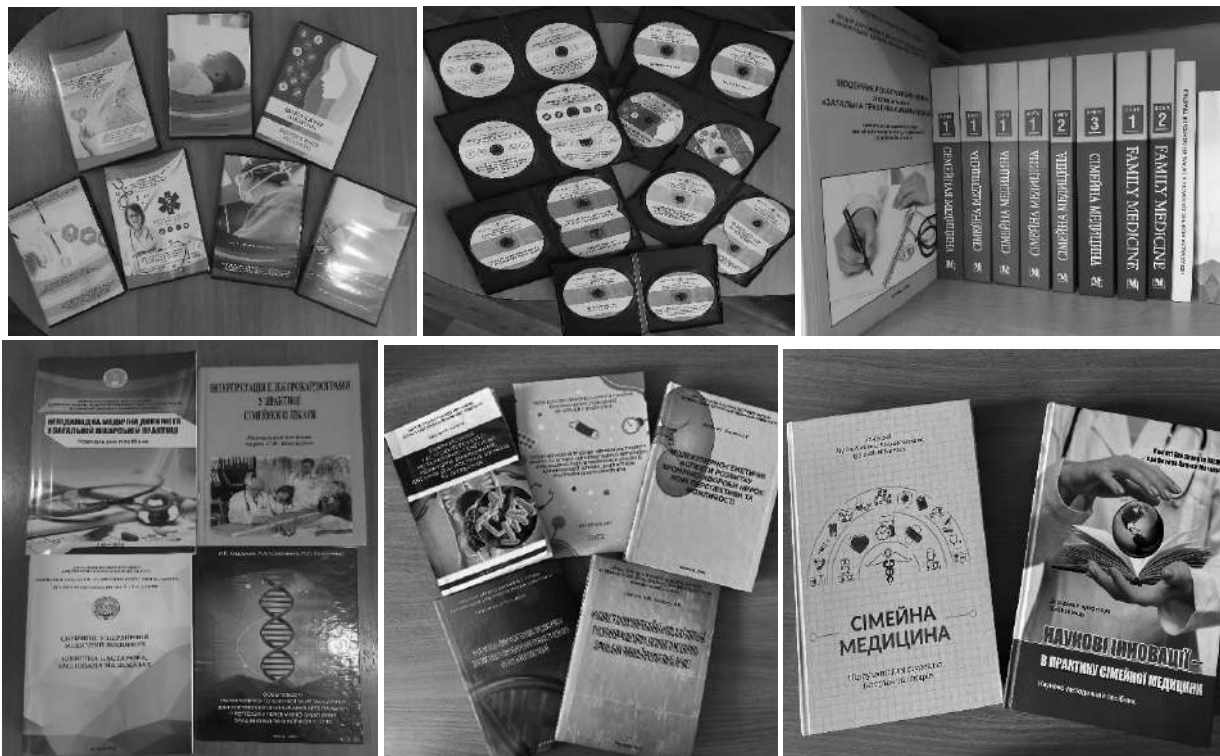
Фото 9. Окремі навчально-методичні матеріали видані кафедрою сімейної медицини БДМУ чи за співучасті її співробітників за останні 5 років