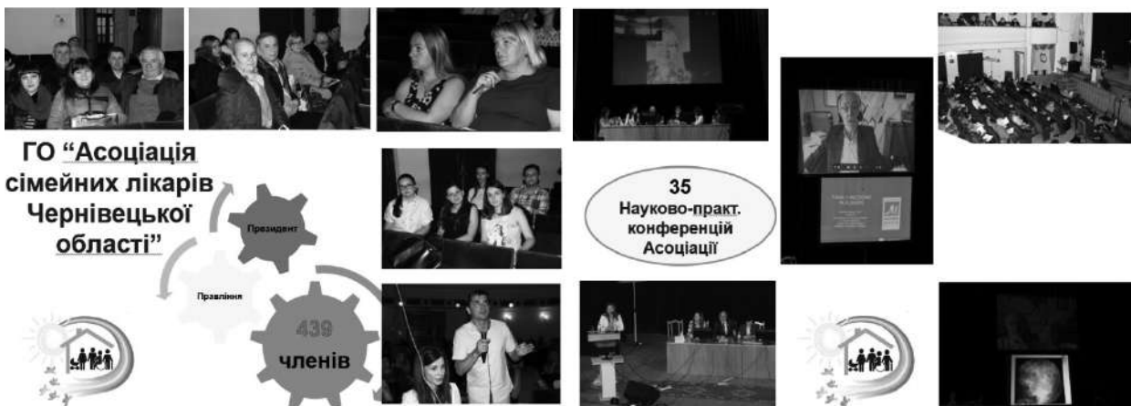
Фото 15. Засідання ГО «Асоціація сімейних лікарів Чернівецької області»