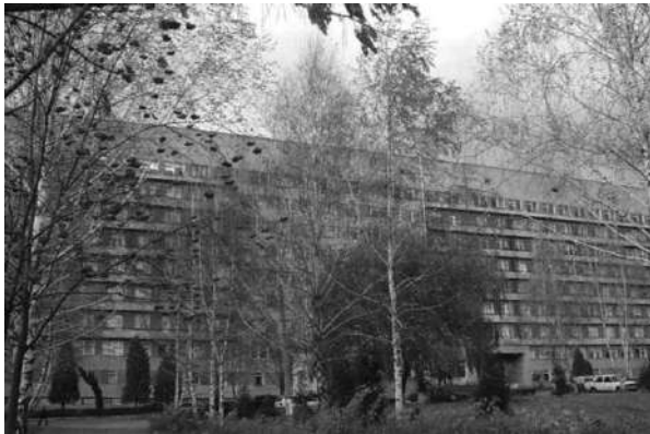
Фото 4. ОКНП «Лікарня швидкої медичної допомоги»

Основними напрямками у забезпеченні підготовки лікарів за спеціальністю «Загальна практика – сімейна медицина» (ЗПСМ) на післядипломному рівні є інтернатура, яка триває два роки, а також проводиться первинна спеціалізація за фахом «Загальна практика – сімейна медицина» (ЗПСМ) лікарів інших спеціальностей. Окрім того, викладаються дисципліни «Медсестринство в сімейній медицині» для студентів 3-4 курсів та «Сімейна медицина» для студентів 2-го курсу медичного факультету № 4 з відділенням молодших медичних і фармацевтичних фахівців зі спеціальності «Медсестринство» (освітньо-кваліфікаційний рівень – молодший спеціаліст, бакалавр, магістр).