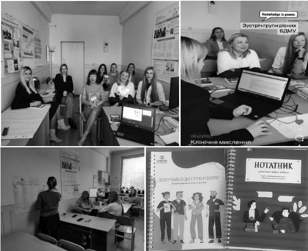
Фото 10. Засідання група рівних на кафедрі сімейної медицини на тему «Позиційне доброякісне запаморочення» (практичне відпрацювання викладачами кафедри клінічного кейсу та проби Дикса-Холпайка), лютий 2024 року