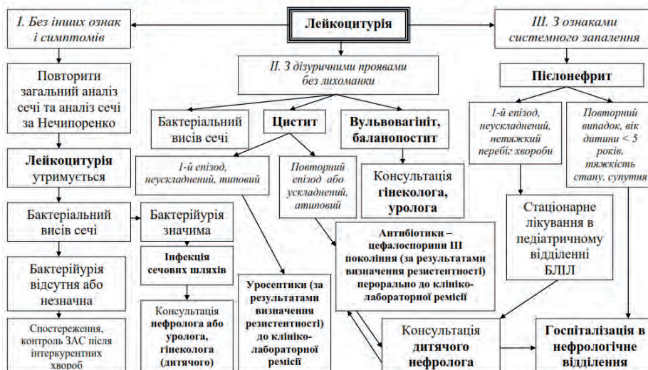
Рис. 1. Клініко-діагностичний алгоритм дій лікаря при лейкоцитурії