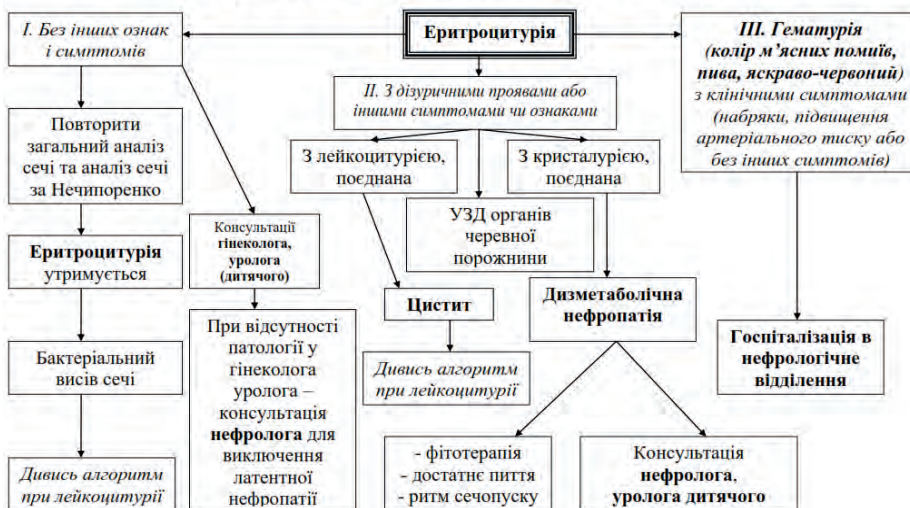
Рис. 3. Клініко-діагностичний алгоритм дій лікаря при еритроцитурії