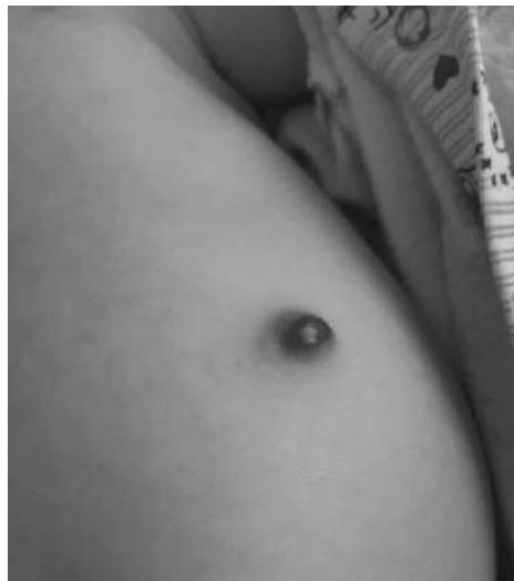
Рис. 1. Зовнішній вигляд гемангіоми у дитини на момент поступлення.