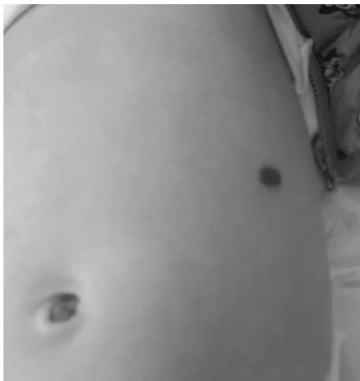
Рис. 3. Зовнішній вигляд гемангіоми через 3 місяці лікування анаприліном.

При повторному огляді через 2 місяці у дитини зберігалася неврологічна симптоматика у вигляді відсутності смоктального рефлексу. За даними ультразвукового дослідження печінки відзначалася позитивна динаміка за рахунок зменшення розмірів утворень та інволюція гемангіоми передньої черевної стінки (рис. 3).