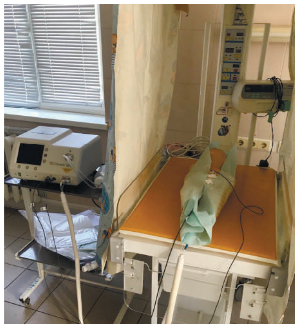
Рис.1. Апарат для проведення ЛГ