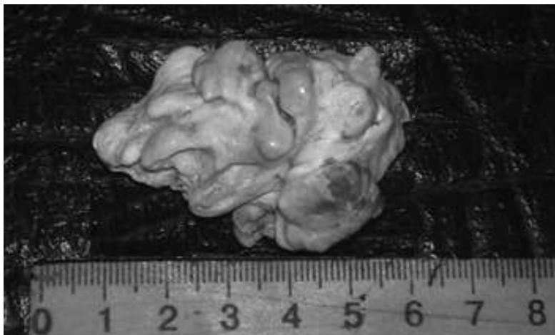
Рис. 2. Компактна остеома

стінці пазухи і тісно прилягала до останньої. Значними зусиллями за допомогою долота і елеватора остеома вивихнута з ложа і видалена. Новоутворення кісткової щільності, розміром 25 × 20 × 14 мм з гладкою поверхнею, загальною масою 22 г (рис. 2).