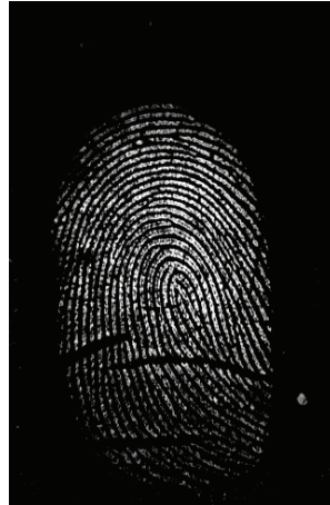
Fig. 3. Dermatoglyphs obtained with the Futronic's FS80 scanner.

Conclusions. Comprehensive methods of anthropometric and dermatoglyphic research will improve the quality of forensic identification examinations and optimize the efforts of experts in the study of victims of mass deaths.