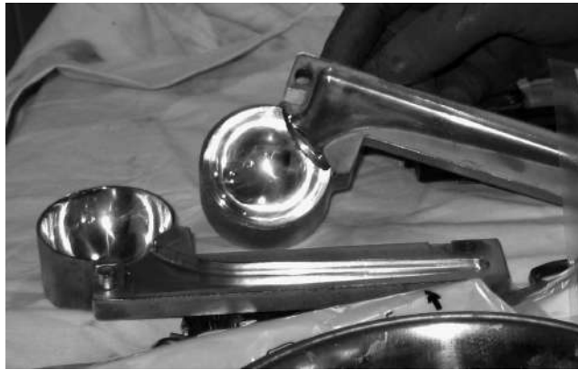
Рис. 2. Прес-форма для інтраопераційного виготовлення спейсера