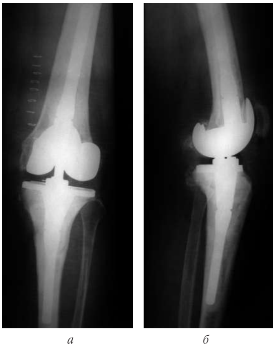
Рис. 12. Рентгенограми лівого колінного суглоба хв-їЯ. після другого етапу ДРЕ з установкою Zimmer Nexgen LCCK: пряма ( а ) та бокова ( б ) проекція

Розроблений нами набір прес-форм семи типорозмірів дозволяє швидко виготовити під час операції спейсер проксимального кінця стегнової кістки потрібного розміру, що за формою точно імітує однополюсний ендопротез. Виготовлення спейсера з використанням прес-форми виконує операційна медсестра, що еконо-