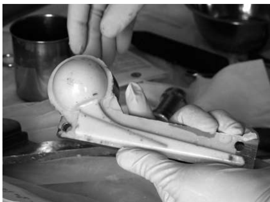
Рис. 5. Готовий цементно-антибіотиковий спейсер у відкритій прес-формі