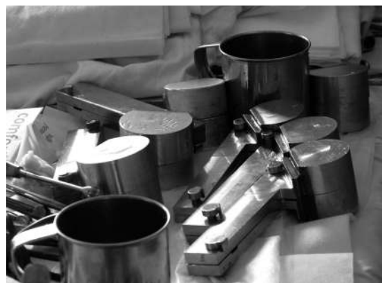
Рис. 6. Набір прес-форм для інтраопераційного виготовлення спейсерів кульшового суглоба

теза, ретельну ревізію оточуючих тканин та промивання антисептичними розчинами. Залишки цементу, кісти, секвестри видаляли до здорової кістки. Інтраопераційно двокомпонентний артикулюючий цементно-антибіотиковий спейсер виготовляли вручну, заповнюю-