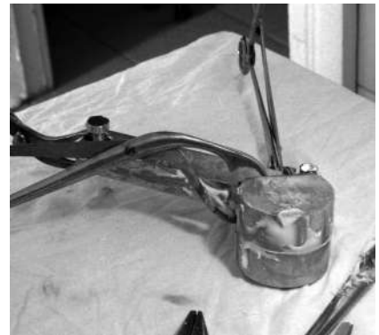
Рис. 4. Закрита прес-форма, у якій полімеризується цементний спейсер