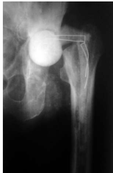
Рис. 9. Рентгенограма лівого кульшового суглоба хв-го П. через 1,5 року після встановлення цементного спейсера