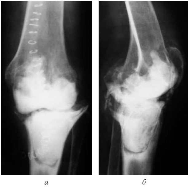
Рис. 11. Рентгенограми лівого колінного суглоба хв-їЯ. після першого етапу ДРЕ із встановленням артикулюючого цементного спейсера: пряма ( а ) та бокова ( б ) проекція