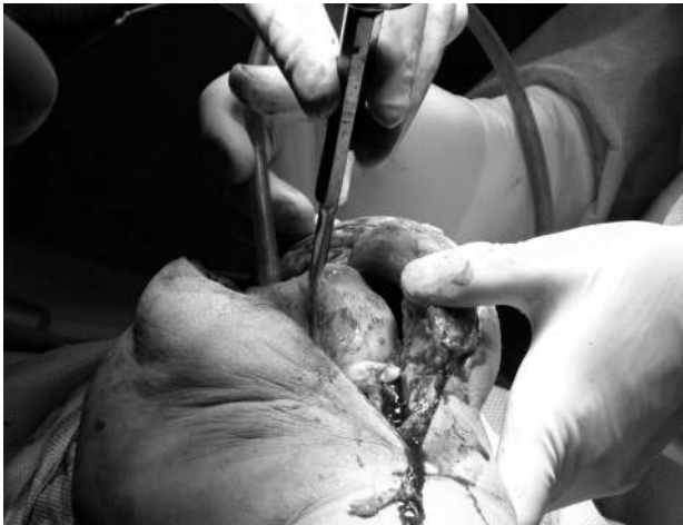
Рис. 7. Двокомпонентний артикулюючий спейсер колінного суглоба під час його видалення

Другий етап виконували через 6–8 тижнів після першого за умови клінічного та лабораторного підтвердження відсутності інфекції. Він полягав у видаленні спейсера та встановленні ревізійного ендпротеза.