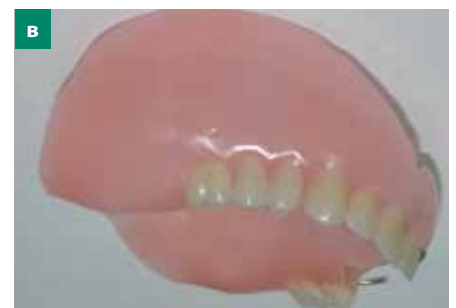
Мал. 1. а) пацієнтка, 59 років, захисна пластинка, коригована пацієнткою самостійно внаслідок болю, спричиненого рецидивом основного захворювання; б) пацієнт, 45 років, резекційний протез із самофіксацією (бік резекції); в) пацієнт, 57 років, резекційний протез з піднятим вестибулярним краєм та фіксацією за природні зуби дентоальвеолярними кламерами