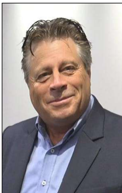
Фото: Джозеф Шейфер - один із основоположників ППК, дипломований спеціаліст Міжнародного Коледжа Прикладної Кінезіології. З 2015 року проводить семінари в Україні.