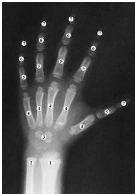
Рисунок 2. Рентгенограма кисті дитини (1 рік і 4 міс.)

Примітки: 1 - променева кістка, 2 - ліктьова кістка, 3 - хрящовий остов кісток зап'ястка; 4 - п'ясткові кістки; 5 - проксимальні фаланги пальців; 6 - середні фаланги пальців; 7 - кінцеві (дистальні) фаланги пальців