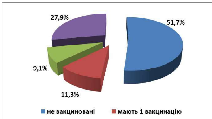
Рисунок 3. Вакцинальний статус дітей, що захворіли на кір за період спалаху

ном, більшість дітей, які захворіли на кір, не мали повного комплексу щеплень проти кору, що значно вище кількості захворілих дітей із проведеними щепленнями.