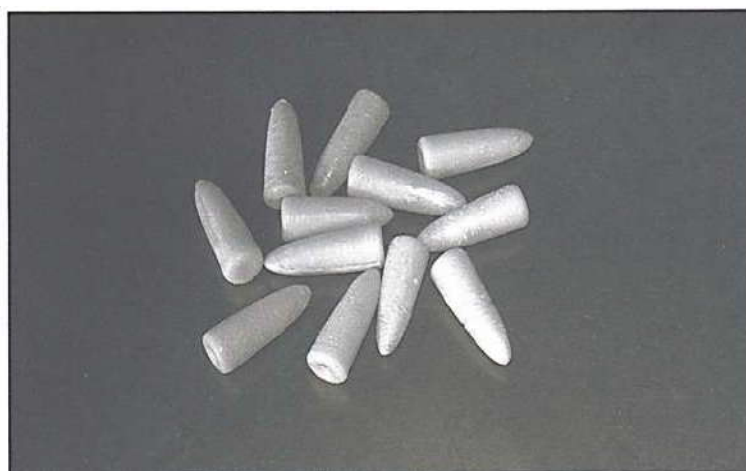
Рисунок 2. Супозиторії, приготовлені за допомогою пристрою форми згідно рецепта, приведенного в тексті роботи

Для повторної підготовки пристрою до роботи пот-