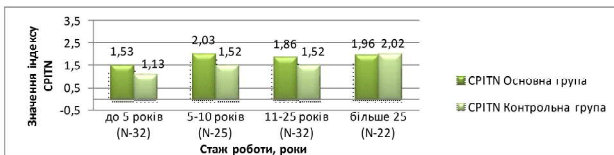
Рисунок 4. Показники індексу CPITN в основній та контрольній групах

ня більш детального дослідження тканин пародонта лабораторними методами та вибору індивідуальних засобів догляду за ротовою порожниною. Заразом працівники контрольної групи спостереження зі стажем роботи до 5 років потребують лише навчання навичок гігієни ротової порожнини.