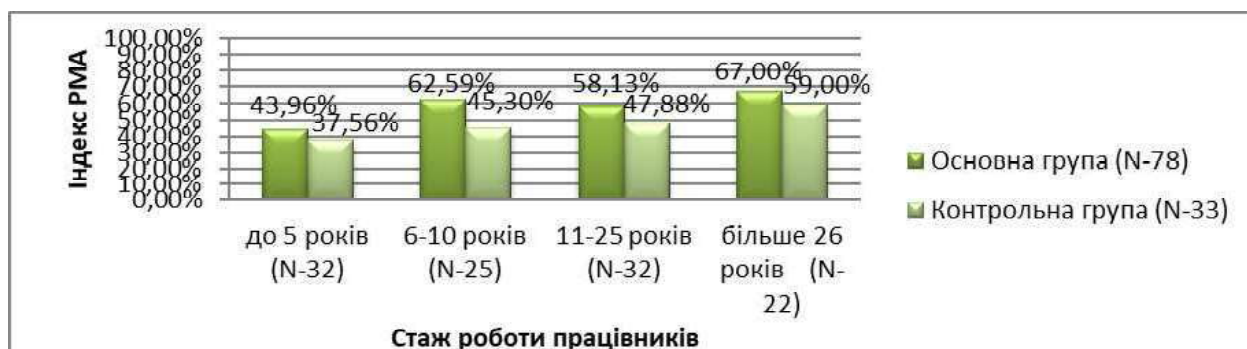
Рисунок 2. Показники індексу РМА в основній та контрольній групах