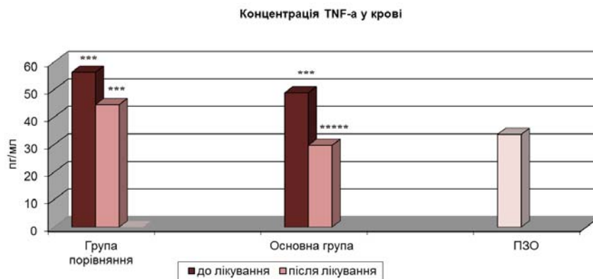
Рис. 1. Динаміка вмісту фактора некрозу пухлин- \alpha у крові хворих на цироз печінки невірусного походження впродовж лікування

Динаміка змін біохімічних показників крові, які відображають процеси цитолізу, запалення та холестазу в паренхімі печінки є загальноприйнятими критеріями ефективності лікування хворих на хронічні дифузні захворювання печінки, зокрема ЦП. У нашому дослідженні достовірне зниження концентрації загального та прямого білірубину, активності ГГТП упродовж лікування спостерігали в осіб обох груп (табл. 1). Клінічно зазначене проявлялось у швидшому регресі іктеричності шкірних покривів та слизових оболонок, зменшенні проявів інтоксикаційного синдрому та холестазу з нормалізацією відтоку жовчі. Проте навіть після проведеного двотижневого лікування концентрація загального та прямого білірубину в крові частини з обстежених пацієнтів була вищою за такі в практично здорових осіб. В обстежених пацієнтів також спостерігалася тенденція до зниження активності АсАТ та АлАТ, які після лікування все ж були вищими порівняно з контрольними показниками (табл. 1), що вказує на