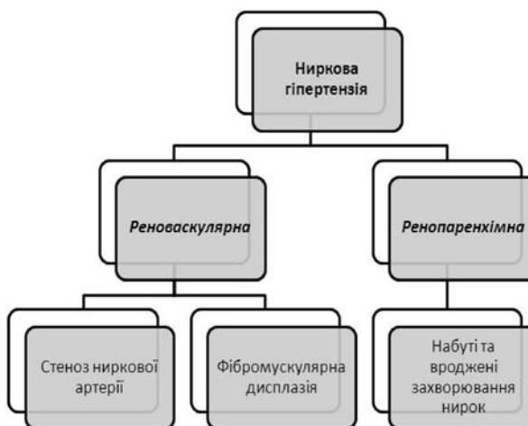
Рис. 2. Класифікація артеріальної гіпертензії ниркового походження