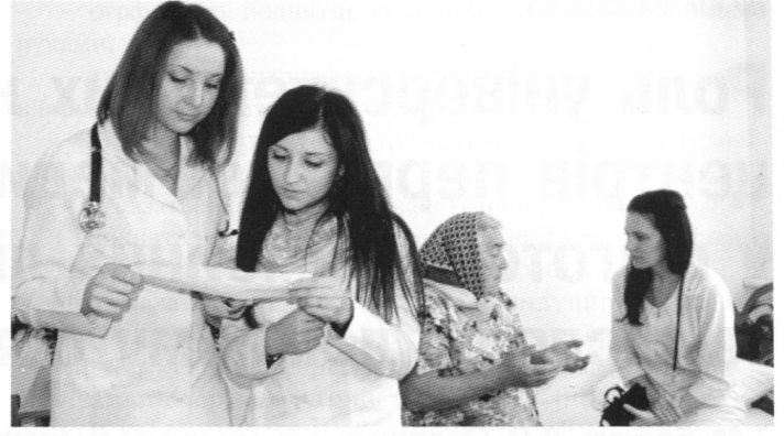
Фото. 3–4. Навчальний процес в умовах навчально-практичних центрів ПМСД БДМУ

ної медицини згідно з існуючими вітчизняними та світовими стандартами (при цьому враховують кваліфікаційну характеристику лікаря загальної практики–сімейного лікаря з позиції компетентнісного підходу, об'єм медичних компетенцій і забезпечення маршрутів пацієнта лікарем загальної практики–сімейним лікарем при різних клінічних станах та захворюваннях);