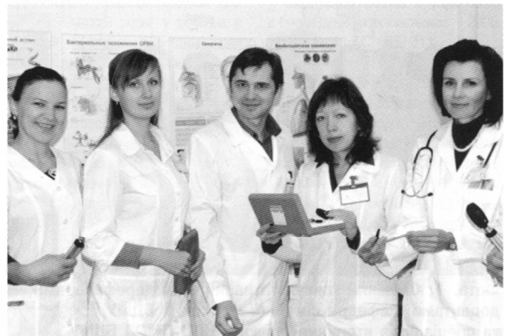
Фото. 5–7. Майстер-класи з офтальмоскопії в умовах НПЦ ПМСД БДМУ