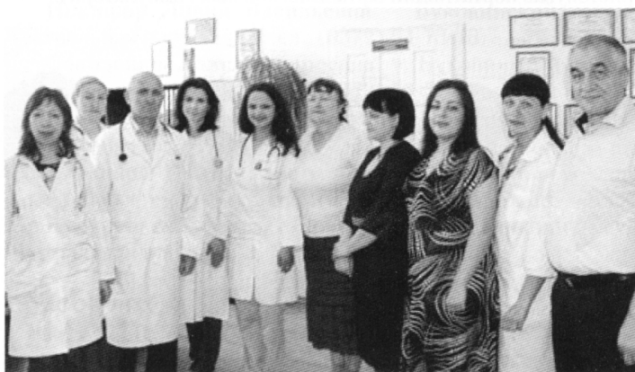
Фото. 1. Спільний консультативний огляд професорами, доцентами кафедри сімейної медицини БДМУ та спеціалістів вторинної ланки у НПЦ ПМСД БДМУ в с. Коровія Глибоцького району

З метою забезпечення безперервної професійної підготовки медичних працівників первинної ланки необхідним є створення обласних тренінгових або навчально-практичних центрів [2]. Рациональним є відкриття наведених центрів на базі зразкових амбулаторій загальної практики–сімейної медицини (АЗПСМ). Завданням таких центрів є сприяння організації проведення короткотривалих тематичних курсів для медичних працівників центру первинної медико-санітарної допомоги (ПМСД) без відриву від виробництва шляхом надання приміщень та матеріально-технічних засобів, необхідних для здійснення навчального процесу навчальним закладом, або організації дистанційних форм навчання. Окрім