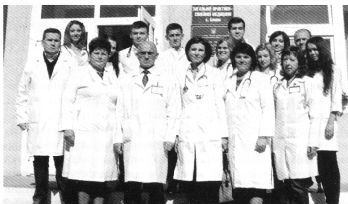
Фото. 2. Виїзд професорів, доцентів кафедри сімейної медицини, студентів до НПЦ ПМСД БДМУ в с. Бояни Новоселицького району

того, центри, безумовно, є необхідними і для проведення навчального процесу на додипломному етапі, оскільки більшість випускників вищих навчальних медичних закладів, маючи достатні теоретичні знання та навички, психологічно не готові до роботи сімейним лікарем у сільській місцевості, адже система їхньої професійної підготовки не передбачає детального ознайомлення зі специфікою роботи в АЗПСМ.