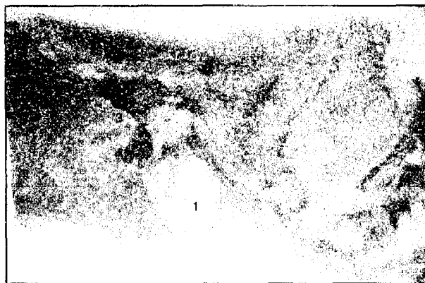
Рис. 4. Сажітальний розріз голови плода 255,0 мм ТКД. Зб. 1:3,2: 1 – барабанна перетинка, 2 – надбарабанний закуток, 3 – печера соскоподібного відростка

товщина якого – 1,05 \pm 0,05 мм. На зовнішній поверхні соскоподібного відростка наявна лусково-соскоподібна щілина, що заповнена сполучною тканиною. Передня стінка печери міститься на рівні заднього краю барабанного кільця, а нижня стінка – вище рівня його верхнього краю на 1,84 \pm 0,07 мм.