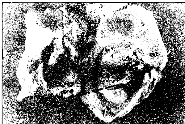
Рис. 1. Сажітальний розріз барабанної порожнини плода 265,0 мм ТКД. Зб. 1:3,8: 1 – вікно присінки, 2 – мис, 3 – вікно завитки, 4 – барабанна перетинка

нка і не має кісткової стінки. Слухова труба пряма, широка, циліндричної форми. Кістковий відділ і перешийок у неї відсутні. Спостерігалась неправильна, трикутна та прямокутна форми барабаних отворів слухових труб, які розташовані в нижньому відділі барабанної порожнини (рис. 2). Глоткові отвори слухових труб розташовані на рівні твердого піднебіння (рис. 3).