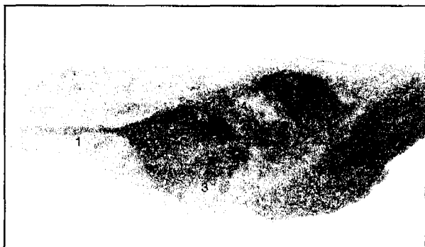
Рис. 2. Сажітальний розріз скроневої кістки плода 240,0 мм ТКД. Зб. 1:3,2: 1 – слухова труба, канал внутрішньої сонної артерії, 2 – вікно присінки, 3 – вікно завитки, 4 – канал лицевого нерва, 5 – печера соскоподібного відростка

Печера соскоподібного відростка (рис. 4) розташована поверхнево під кірковим шаром,