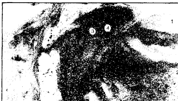
Рис. 3. Сажітальний розріз голови плода 235,9 мм ТКД. Зб. 1:3,2: 1 – ротова порожнина, 2 – язик, 3 – носоглотка, 4 – глотковий отвір слухової труби