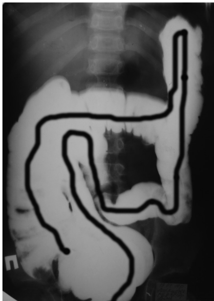
Рис.1. Дівчинка К., 12 років. Доліхосигма з порушенням евакуаторної функції, високим положенням ЛВОК без розширення прямої кишки (іригографія)

Об'єктивно дитина кахектична, важить 16 кг при рості 129 см. Шкіряні покриви бліді, дещо із жовтушним відтінком, тургор тканин понижений. Живіт збільшений в об'ємі, відмічається метеоризм, при пальпації болючий на всьому протязі, більше в лівій боковій ділянці, симптомів подразнення очеревини немає. При проведенні іригографії визначали дві петлі сигмоподібної ободової кишки (СОК), які поширюються на праві відділи ободової кишки; високе положення лівого вигину ободової кишки (ЛВОК) (зміщення лівого вигину ободової кишки, відносно правого більше тіла двох хребців) без розширення прямої кишки; функція випорожнення була незадовільною (рис. 1).