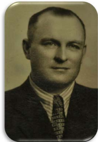
проф. Б.Л. Радзіховський