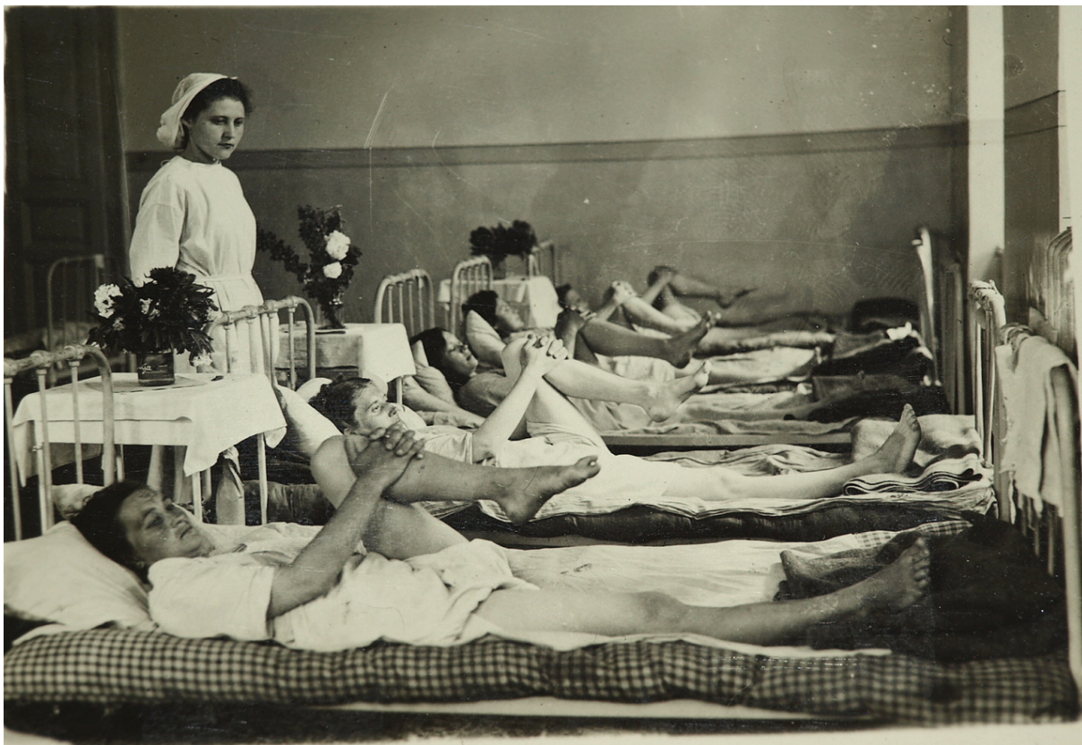
Лікувальна гімнастика в акушерсько-гінекологічній клініці.