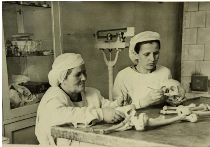
Препарувальна лабораторія при кафедрі топанатомії. Фото 1946 р.