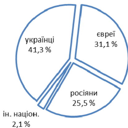
Рис. 3. Національний склад студентів ЧДМІ (I семестр 1946 р.)