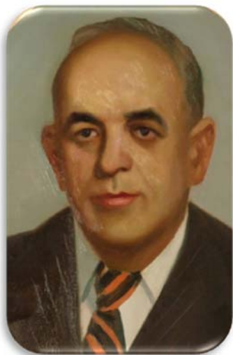
проф. О.Ю. Мангейм