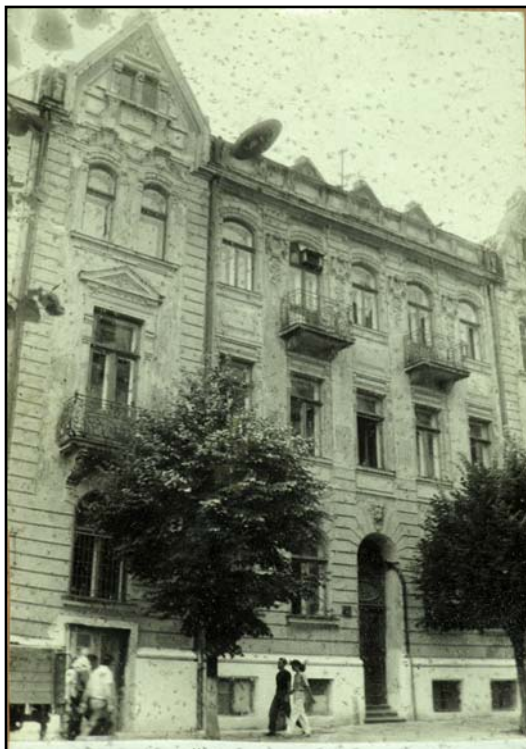
Гігієнічний корпус на вул. О. Кобилянської, 42. Фото 1994 р.