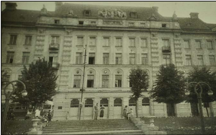
Адміністративний корпус на вул. Театральній, 2 (Театральній площі, 5). Фото 1954 р.