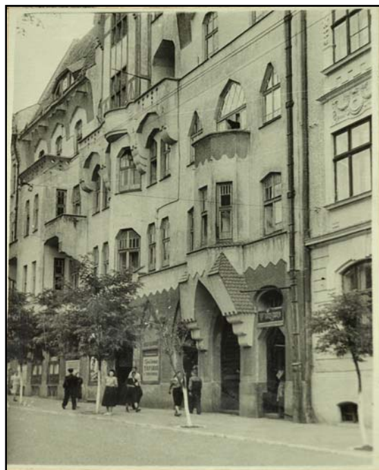
Німецький дім (у минулому гуртожиток ЧДМІ на вул. О. Кобилянської, 53). Фото 1952 р.