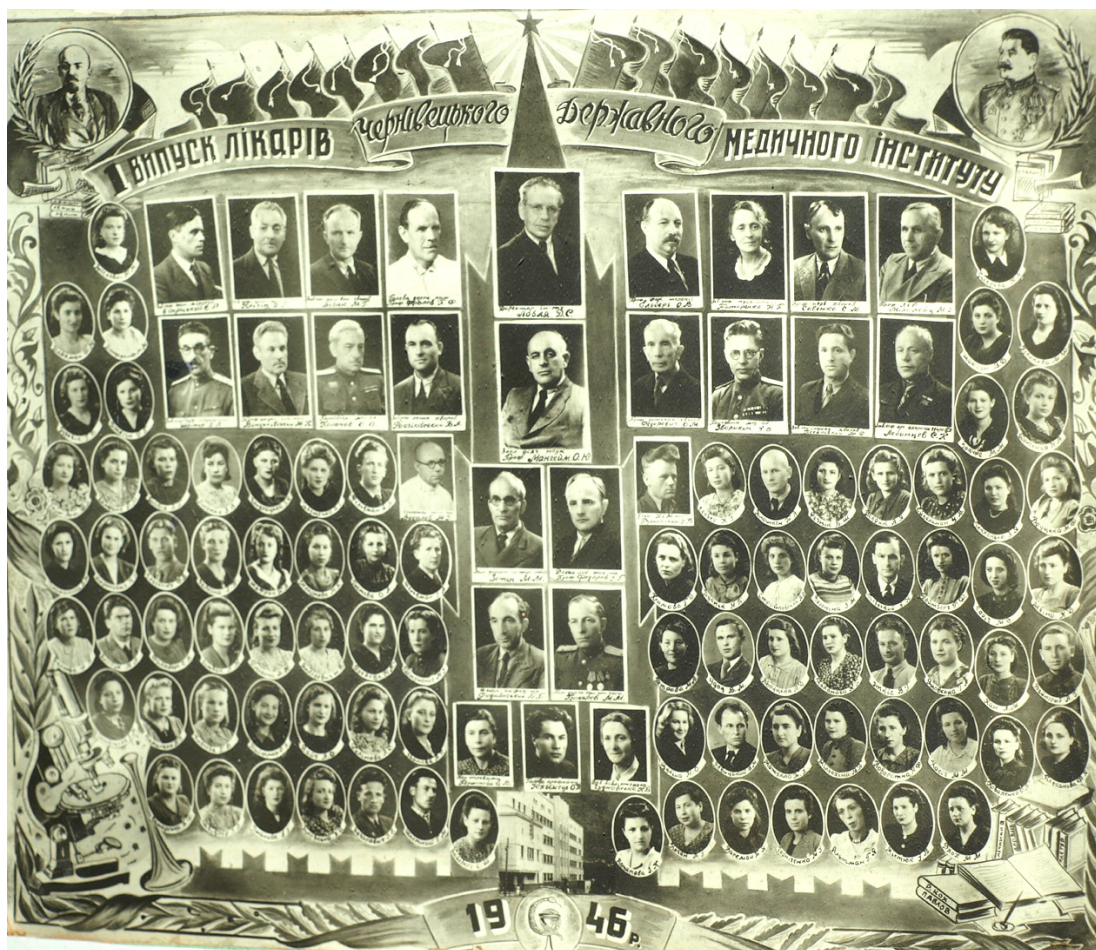
Перший випуск лікарів у 1946 р. Історико-медичний музей БДМУ