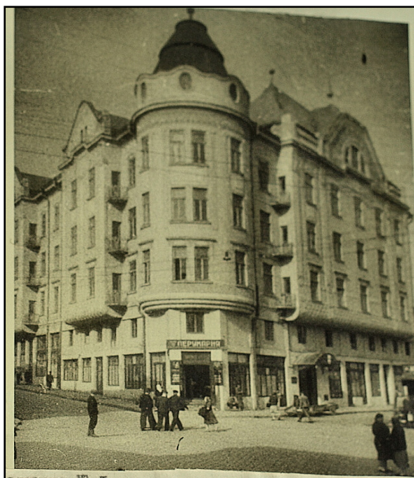
Гуртожиток. № 1 на вул. М. Заньковецької, 11 (приміщення готелю «Брістоль», вул. Дачія, 1). Фото 1954 р.