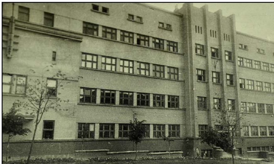
Теоретичний корпус на вул. Богомольця, 2 (вул. Т. Масарика, 2). Фото 1954 р.