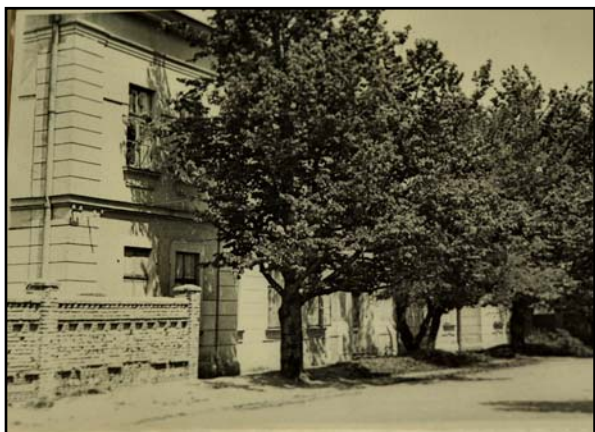
Морфологічний (анатомічний) корпус на вул. Ризькій, 3 (вул. Балмаша, 3). Фото 1956 р.