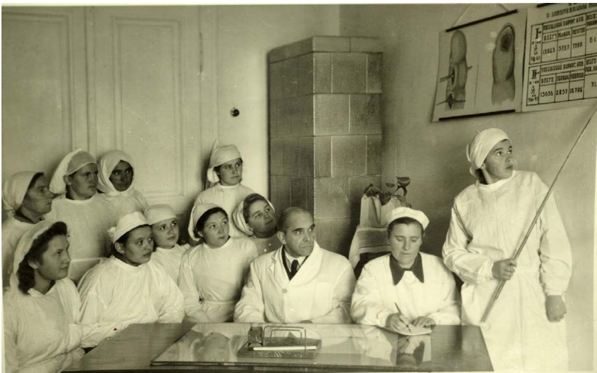
Заняття студентського наукового гуртка на кафедрі топоанатомії з оперативною хірургією. Фото 1946 р.