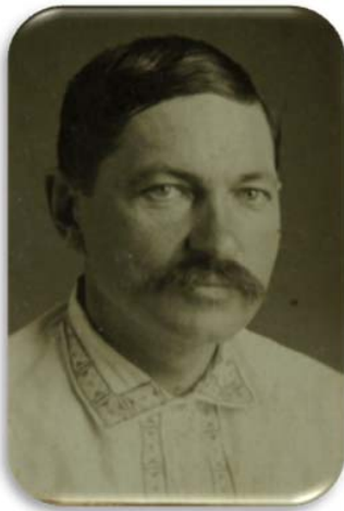
проф. Ф.М. Гуляницький