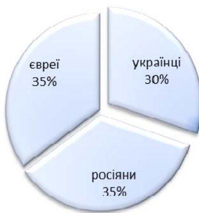
Рис. 2. Національний склад проф.-викл. складу ЧДМІ станом на 1 березня 1946 р.