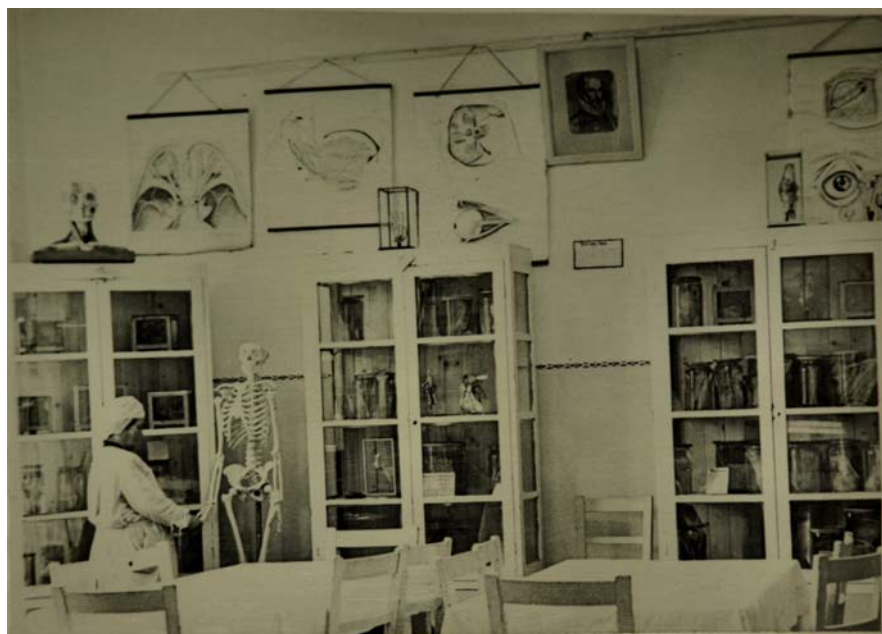
Топографо-анатомічний музей. Фото 1946 р.