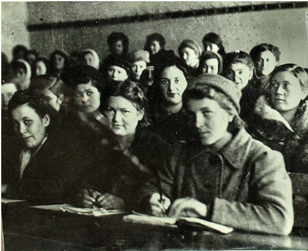
Студенти I курсу на лекції. Фото 1944 р. Історико-медичний музей БДМУ