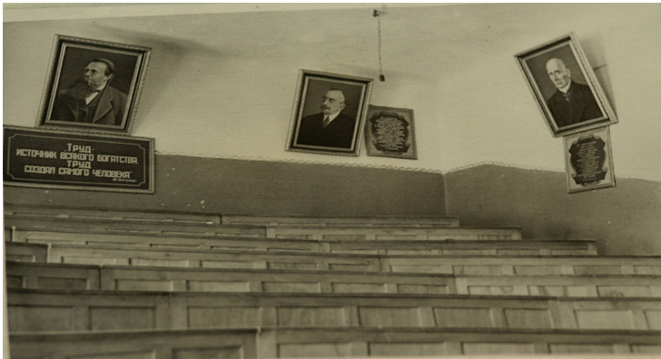
Лекційна зала у морфологічному корпусі. Фото 1946 р.