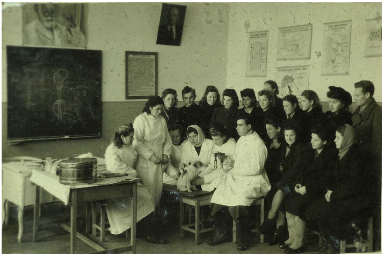
Практичні заняття на кафедрі нормальної фізіології. Фото 1945 р. Історико-медичний музей БДМУ