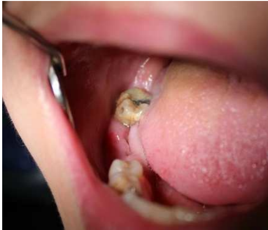
Рис. 4. Початок епітелізації лунки 46 зуба