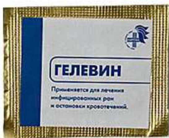
Рис.1 Медичний сорбент «Гелевін»