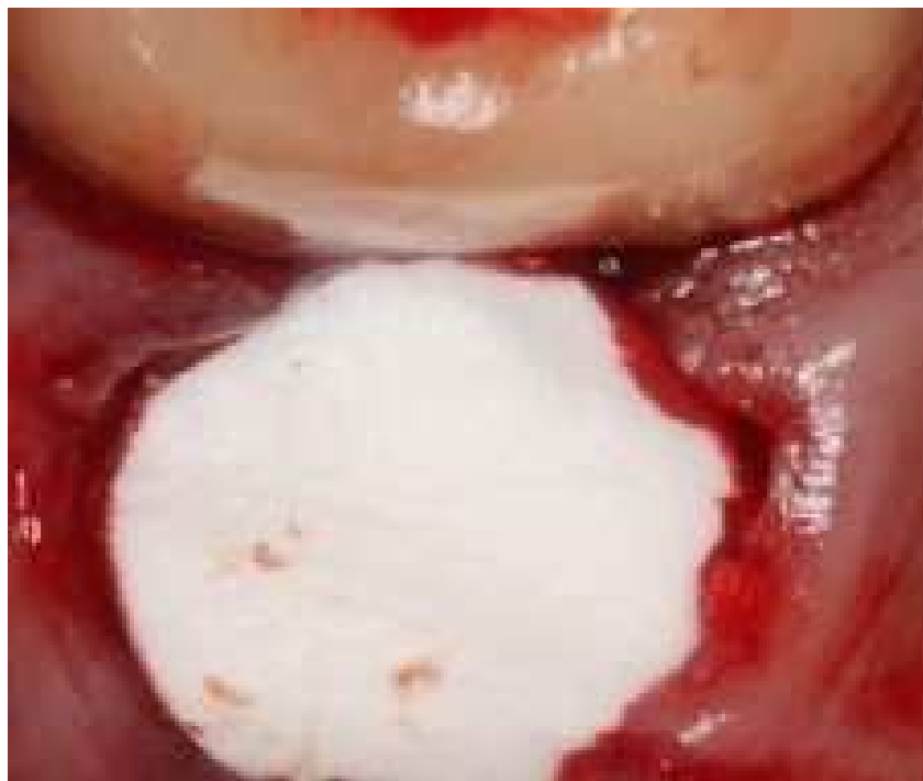
Рис. 3 Лунка 46 зуба заповнена порошком «Гелевін»

У хворих КГ, яким проводилось лише традиційне лікування, біль і запальні явища стихали тільки на 4-у добу, очищення лунки і поява перших грануляцій спостерігалось під кінець 7-ї доби, а початок епітелізації лунки - на 9-у добу.