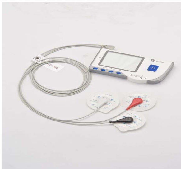
Рис. 2. ЕКГ із під'єднаними грудними датчиками

Таким чином, поетапне визначення аритмій може оптимізувати скринінгове дослідження провідної функції серця у дітей шкільного віку.