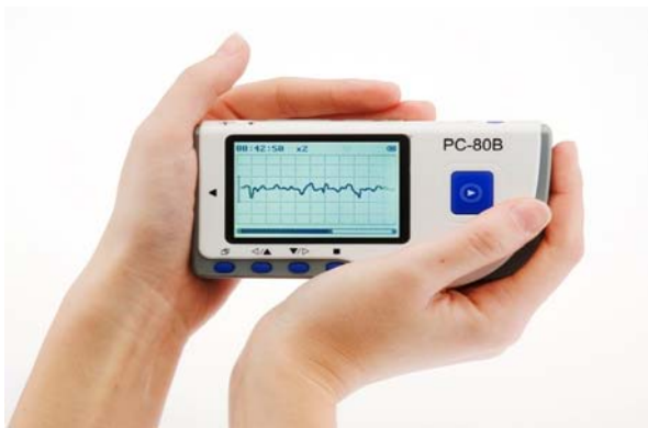
Рис. 1. Зняття ЕКГ на долонних датчиках