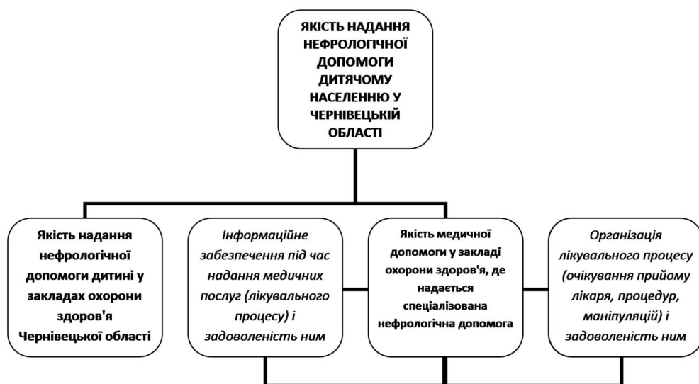
Рис. 1. Структурне «групування» запитань для респондентів

З метою виявлення медико-організаційних чинників, що можуть впливати на задоволеність якістю надання нефрологічної допомоги, результати опитування були піддані кореляційному аналізу та представлені (рис. 2) у вигляді кореляційних плеяд, при формуванні яких враховувалися прямі і зворотні зв'язки з рівнем кореляції r \geq 0,3 .