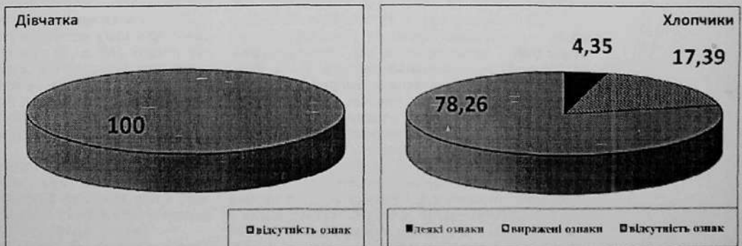
Рис. 2. Схильність учнів 7-х класів до девіантної поведінки (%)