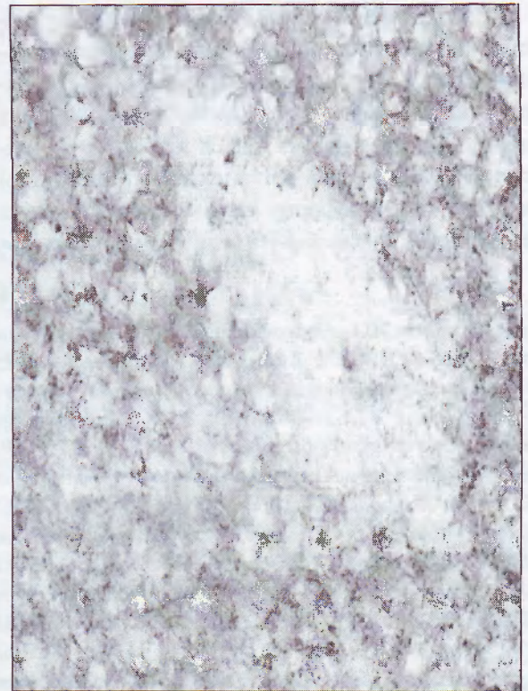
Рис. 3. Гостра гемічна гіпоксія. Гальмування активності сукцинатдегідрогенази в печінці з максимальним зниженням її активності на рівні третьої функціональної ділянки та розширення просвіту центральної вени. Зб. 400 \times .

Дистальний відділ нефрону з проявами активності СДГ ідентифікували за діаметром канальців, які в середньому вдвічі менші за проксимальні відділи нефрону, а також брали до уваги те, що дистальні канальці віддалені від ниркових клубочків [4-5]. Гальмування транспорту іонів натрію в проксимальному відділі нефрону внаслідок гіпоксичного впливу викликало активацію внутрішньониркової ренінаангіотензинової системи за механізмом тубулогломерулярного зворотного зв'язку [9-11]. Все це пояснює зниження біохімічної активності в кліти-