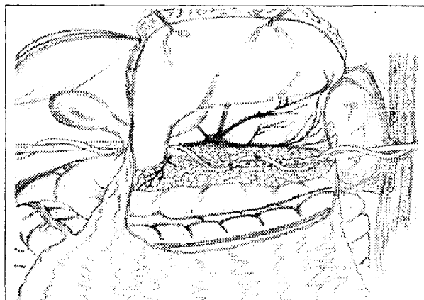
Рис. 2 Спосіб пролонгованого дренивання сальникової сумки при гострому деструктивному панкреатиті (патент № 66934).