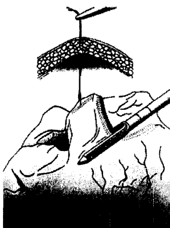
Рис 1. Комбінована ендоскопічна лапароскопічна крайова резекція шлунка при раку